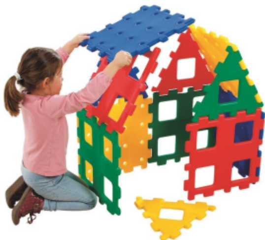
Géoblocs Géants 64 pièces, 520€

Ce nouveau jeu, ainsi que la remise en place dès cette rentrée du bac à sable, dont l'école remercie la mairie, assure aux élèves des espaces de jeux calmes, leur permettant d'alterner le défoulement pour la course et les vélos et le plaisir de jouer et de construire.