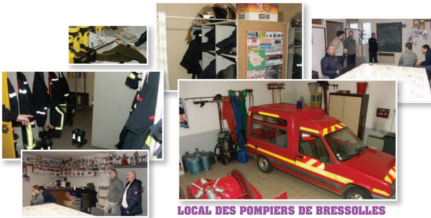
LOCAL DES POMPIERS DE BRESSOLLES