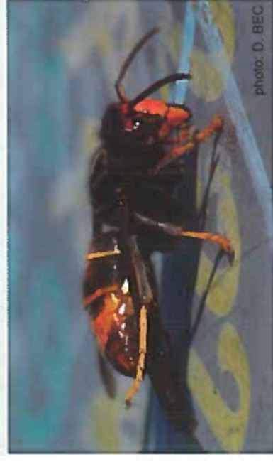
Frelon asiatique photographié à Pérouges en octobre 2015.

Le frelon asiatique mesure entre 2 et 3 cm. Il est plus grand que la guêpe (1,5 cm) et plus petit que le frelon européen (4 cm max).